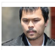
千葉女子大生殺害